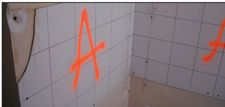
Repérage de colle amiantée sous faïence

Les repérages détaillés ci-dessus sont parfois insuffisants, voire inexistant pour certains d'entre eux. En effet, selon l'ampleur des travaux de rénovation envisagés, le donneur d'ordre (propriétaire ou locataire), n'a pas la certitude que tous les MCA potentiellement présents dans la zone de travaux ont bien été identifiés.