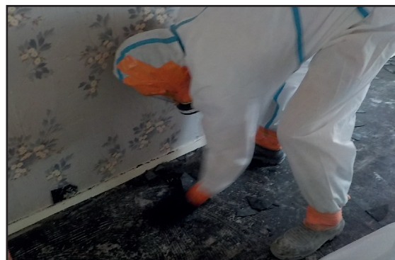
Ramassage de dalles amiantées après travaux

Par ailleurs, le fait d'abandonner des déchets prohibés sur un lieu, même privé, est sanctionné par l'article R.633-6 du Code pénal.