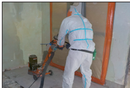
Retrait de colle amiantée par ponçage

Il veillera notamment, pour garantir sa sécurité et celles des occupants, à faciliter le déroulement des travaux et à ne pas interférer dans la zone de travaux.