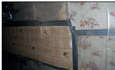
Préparation aux travaux de retrait de colles sous carrelages et sous faïence (sous-section 3)