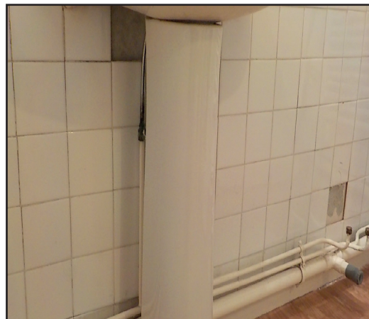
Colle amiantée sous faïence

Si le propriétaire ou le locataire souhaite réaliser lui-même les travaux, il lui est également recommandé d'effectuer cette recherche pour protéger sa propre santé mais aussi celle des tiers qui l'entourent.