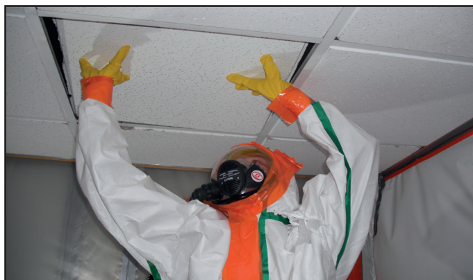
Déplacement de faux-plafond amianté pour intervention

Le remplacement d'un isolant ne contenant pas d'amiante, mais pollué par la dégradation de la couverture amiantée située au dessus, constitue une intervention dite de sous-section 4.