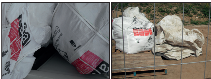
Big bag de déchets amiantés

Le coût des interventions par des entreprises certifiées et qualifiées prend en compte les obligations réglementaires suivantes :